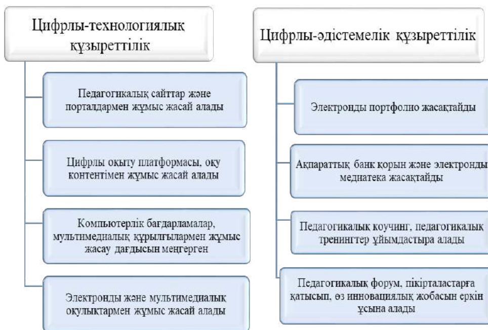
2-сурет – Қашықтықтан оқыту жағдайында болашақ педагогтың цифрлы-технологиялық және цифрлы-әдістемелік құзыреттіліктері

Қашықтықтан білім беру жағдайында болашақ педагогтердің практикалық білімі кәсіби білім беруге бағытталады және педагогикалық жоғары оқу орындарында қашықтықтан білім беру бойынша цифрлы оқу контенттерін оқу-тәрбие процесінде тиімді пайдалану бойынша болашақ педагогтерге арналған онлайн-әдістемелік коучингтер және арнайы онлайн курстар жүргізілуі керек.