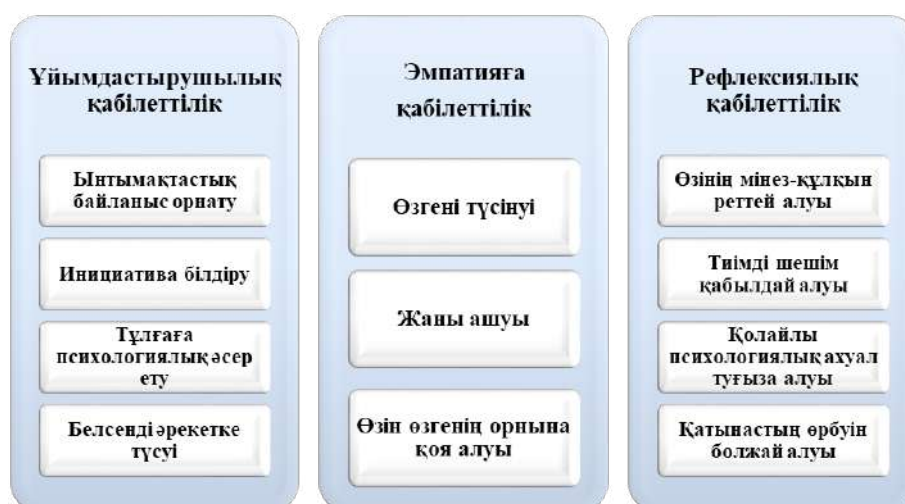
1-сурет – Құзыреттілік компоненттері

Құзыреттілік креативке бастайтын жол. Қысқаша психологиялық сөздікте «креатив» ұғымына төмендегідей анықтама беріледі: «Креатив» (creatio) латын тілінен тікелей аудармасы – «жасап шығару»; «жасырын күш»; «жасап шығаруға қабілеттілік». Креативтілік – өнімді әрекет етуге дайын болу, жаңалық ашуға дайындығын көрсететін индивидтің тұлғалық сапасы. Индивидтің жоғары нәтижелерге жетуге деген тұрақты мотивтерінің болуы (Краткий психологический словарь, 1985:55) [5].